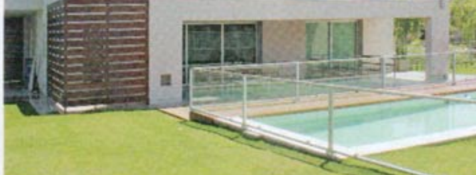
El deck aporta calidez y diseño a la piscina, de líneas simples.

El sistema constructivo es tradicional de mampostería de ladrillos comunes y estructura de hormigón armado con pozos romanos. Las cubiertas son planas en su totalidad y los muros exteriores han sido terminados con revoques plásticos texturados con color incorporado. Las carpinterías exteriores son de aluminio anodizado natural con doble vidrio hermético en su totalidad, diseñada con grandes paños en la fachada posterior y una ventana continua colocada al ras del muro en la fachada principal. La puerta de acceso se mimetiza en conjunto con el cerramiento de la cochera con todo un revestimiento de tablas de madera que acentúan la horizontalidad de la fachada. En el interior se combinaron carpinterías en MDF en color blanco con paños vidriados corredizos que se embuten dentro de los muros. Los pisos utilizados en los ambientes principales son entablados de alta calidad en el sector de living principal y pisos cementicios alisados en el resto de los ambientes. En cuanto a los muros interiores, los mismos han sido terminados con enlucidos de yeso, patinas, revestimientos de venecitas y revoques texturados según sus requerimientos, gustos y necesidades de cada uno de los ambientes.