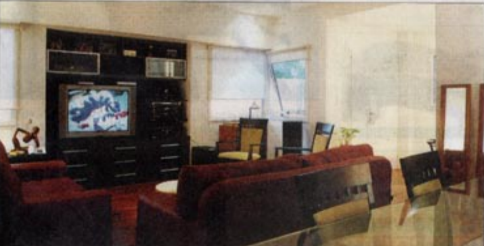
El interior repite el concepto externo: simpleza y finas terminaciones en espacios amplios y diáfanos.