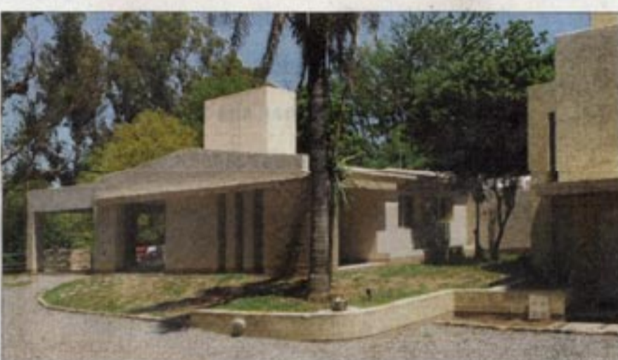
Con buen criterio, los proyectistas mantuvieron una antigua casona "aggiornandola" al resto del complejo.