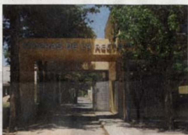
El acceso al complejo se encuentra en uno de los laterales, colindante a los locales comerciales que dan sobre recta Martinoli.