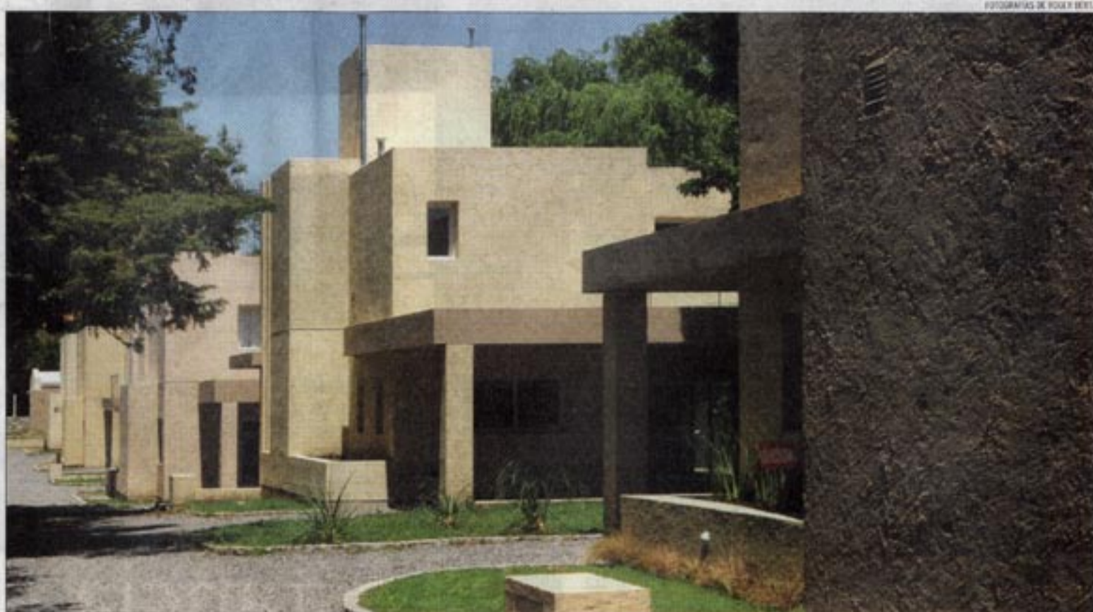
La articulación volumétrica de cada vivienda compone una imagen general armónica y expresiva. El diseño logra una buena privacidad de las unidades dentro del conjunto, ya que los aventanamientos no se enfrentan.