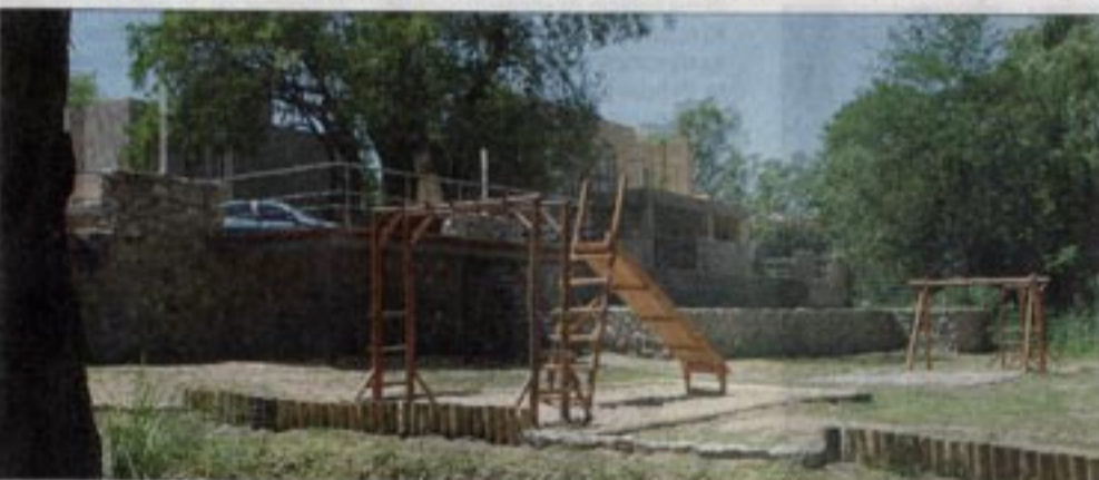
La calle de acceso remata en un "deck" que balconea sobre el espacio de juegos en la margen del río.