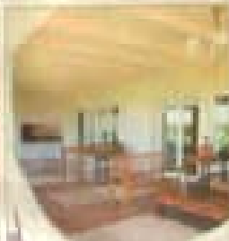
Interior view of the kitchen and living area.

El diseño de esta vivienda se caracteriza por su simplicidad y su integración con el entorno inmediato. El uso de materiales como el concreto y el vidrio le confiere un aspecto contemporáneo. La casa cuenta con tres niveles, lo que permite aprovechar al máximo el espacio disponible. El interior está diseñado para ser funcional y acogedor, con una distribución de espacios que favorece la vida familiar. El exterior también es cuidadosamente diseñado, con un jardín y una piscina que complementan el estilo de la vivienda.